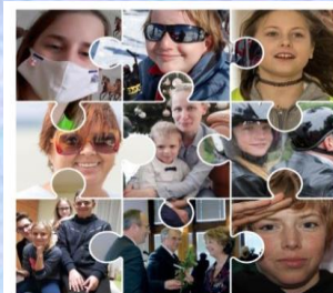
MÉRFÖLDKÖVÉK 30 ÉV A TRANSZPLANTÁCIÓS ALAPÍTVÁNY ÉLÉTEBEN

2021-ben végre ismét meg tudtuk rendezni a Szervdonációs és Transzplantációs Európa- és Világnapot október második szombatján. Rendezvényünk célja tiszteletadás a donoroknak és családtagjaiknak, illetve szolidaritás a szervátültetésre váró betegek iránt.