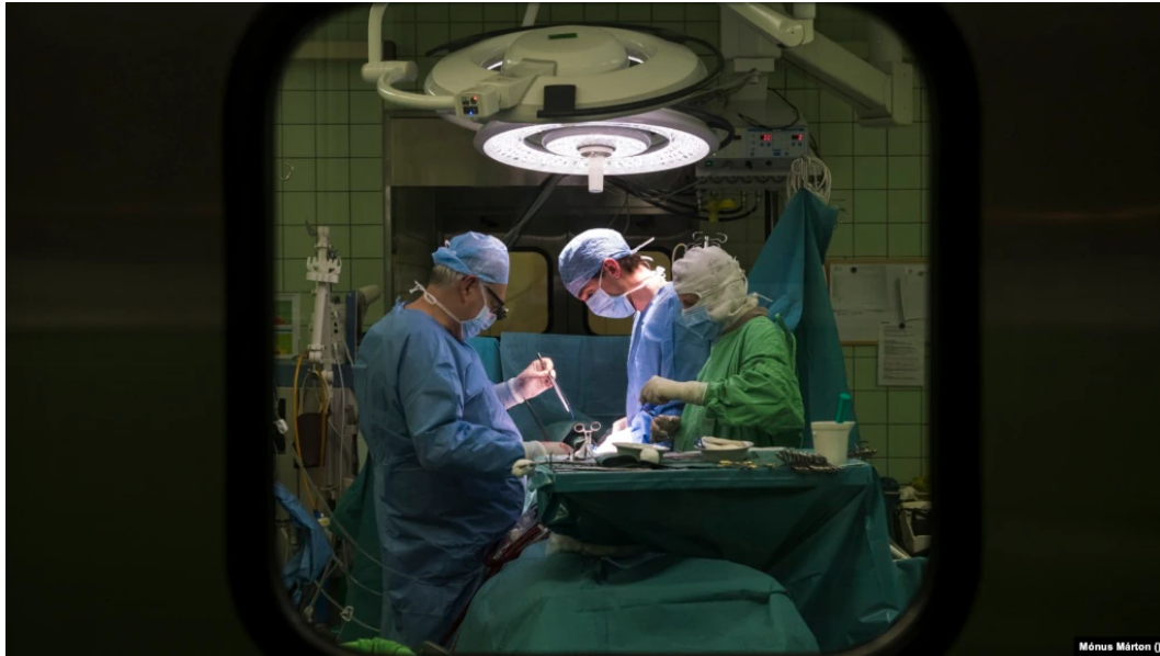
Szívtranszplantációs műtétet végeznek Budapesten 2018. március 3-án

Nem mindenben utánozta a kormány a laboratóriumnak tekintett Ausztriát, ahol az egészségügyi ellátás nem teljesen állt le a járvány alatt. Az intenzív ellátásra épülő szervátültetések száma Ausztriában érdemben nem csökkent, miközben itthon negyedével kevesebb beavatkozást végeztek el.