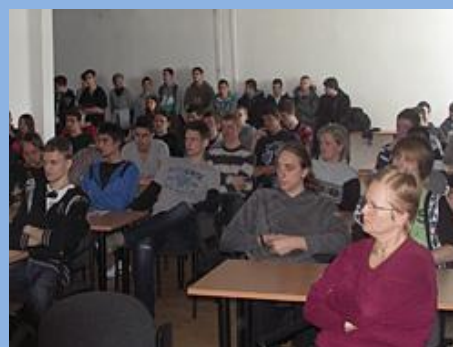
Ismeretterjesztő előadás a soproni Vas- és Villamosipari Szakképző Iskola és Gimnáziumban

A rendezvény méltó befejezése a Magyar Mezőgazdasági Múzeumtól a Hősök teréig vezető, figyelemfelkeltő fáklyás felvonulás volt.