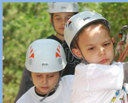
Pillanatkép a nyári élménytáborból