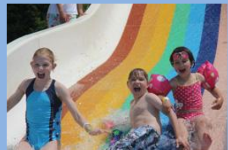
Csúszdázás a mogyoródi gyereknapon