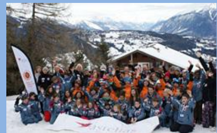
Csoportkép a svájci TACKERS táborból