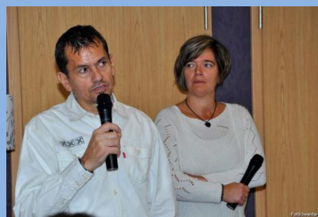
Transzplantációs Fórum Miskolcon