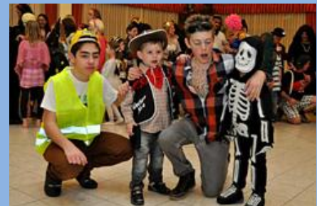
Farsangi bál Tengelicen