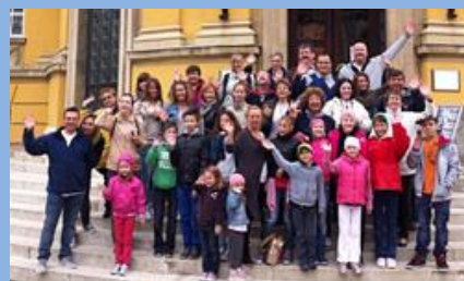
ASTELLAS Családi Hétvége Debrecenben

Köszönjük minden támogatóknak, és önkéntes segítőinknek, hogy feladatainkat a terveink szerint teljesíthettük.