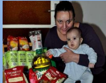
Családsegítő programunk keretében többek között tartós ételkészítők juttatunk a rászorulóknak.