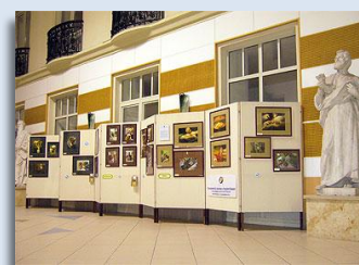
Kiállítás a Sapientia Hittudományi Főiskolán