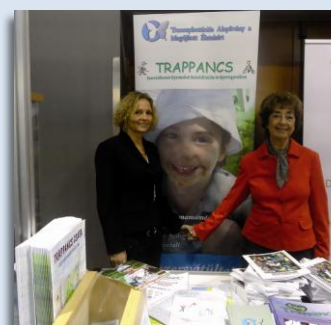
A Dental World Kiállításon