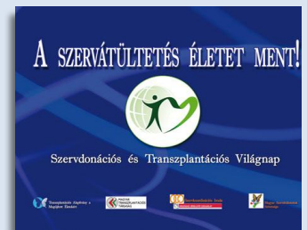
A Világnap plakátja