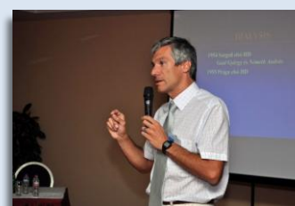
Fórum Vecsésen októberben