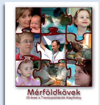
Mér földkövek c. kiadvány a húsz éves Alapítványról