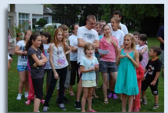
A nyolcadik nyári táborban