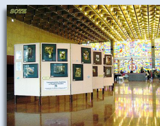
Kiállítás a SOTE Nagyvárad téri épületében

Filmvetítéssel illusztrált ismeretterjesztő előadást tartottunk általános-, és középiskolákban, klubokban, cégek meghívására dolgozóik számára, a Szervkoordinációs Iroda által - a donációban résztvevő orvosok számára – szervezett tanfolyamokon. Kiállítottunk a Syma csarnokban rendezett Dental World kiállítás-konferencia rendezvényen. Részt vettünk négy hazai szakmai konferencián - ebből három alkalommal előadóként.