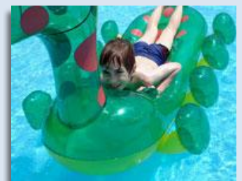
Gyereknap az Aquarénában