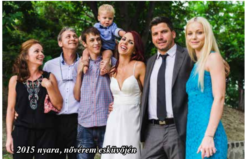
2015 nyara, nővérem esküvőjén

egyből beindultak. Másnap le is tudtak venni a lélegeztetőgépről. A harmadik napon lábraálltam és enni is elkezdhettem. A felépülés látványos volt, napról-napra egyre jobban voltam a fájdalmaim ellenére. Az orvosok és ápolók mindent megtettek, hogy elviselhetőbbé tegyék a lábadozást. Mindenről tájékoztattak, ha kérdésünk volt készségesen válaszoltak. Természetesen a családom végig kint volt velem és minden délután jöttek hozzám a kórházba. 40 nap után hozták haza a Tüdő Klinikára, majd 50 nap után végre a saját ágyamban aludhattam.