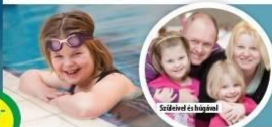
Szűrével és húgával